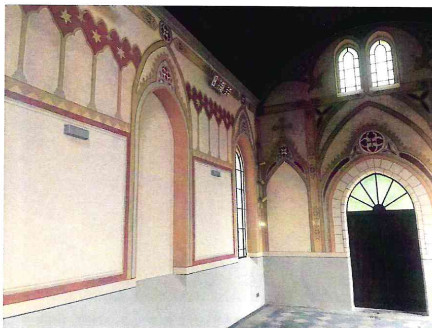
Zdjęcie wnętrza kaplicy po remoncie