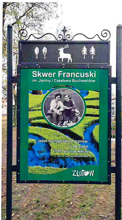
Zdjęcie tablicy ustawionej przy Skwerze Francuskim im. Janiny i Czesława Buchwaldów