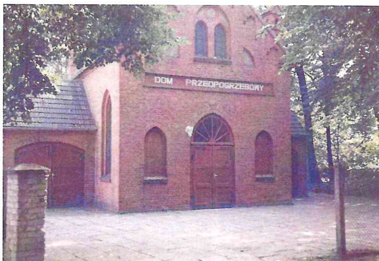
Zdjęcie kaplicy dawniej

Dzięki pozyskanemu dofinansowaniu z Wielkopolskiego Regionalnego Programu Operacyjnego na lata 2014-2020 – Inwestycje w obszarze dziedzictwa kulturowego regionu pn. Remont kaplicy przy ul. Staszica w Złotowie udało się uratować jeden z niewielu złotowskich zabytków przed całkowitym zniszczeniem. Prace zostały podzielone na trzy etapy: