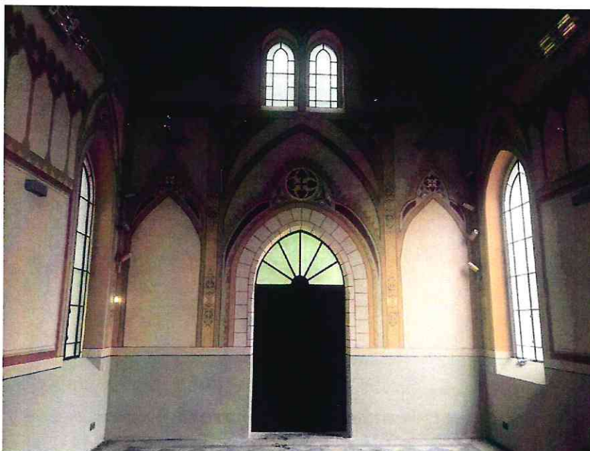
Zdjęcie wnętrza kaplicy po remoncie

Inwestycja była dofinansowana ze środków Wielkopolskiego Regionalnego Programu Operacyjnego na lata 2014 – 2020, Oś Priorytetowa 4. Środowisko, Działanie 4.4. Zachowanie, ochrona, promowanie i rozwój dziedzictwa naturalnego i kulturowego, Poddziałanie 4.4.1. Inwestycje w obszarze dziedzictwa kulturowego regionu.