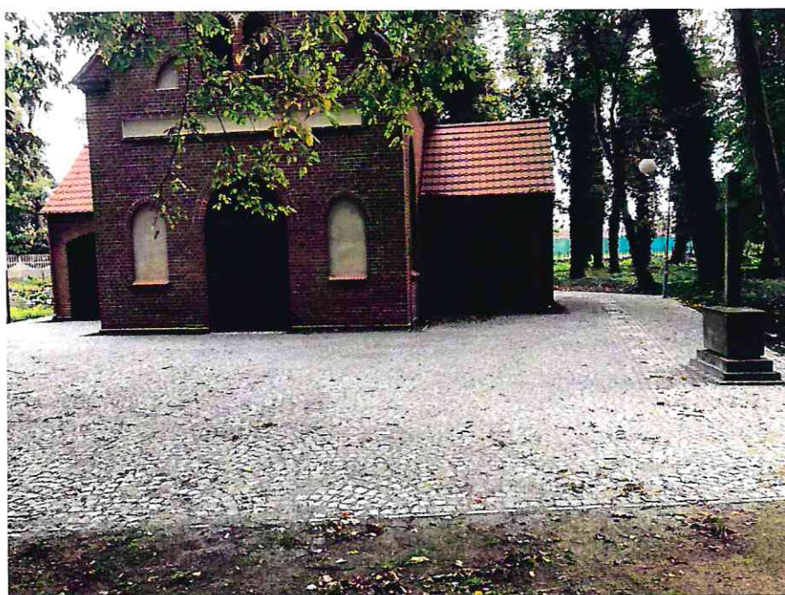
Zdjęcie kaplicy i terenu wokół kaplicy po realizacji utwardzenia terenu