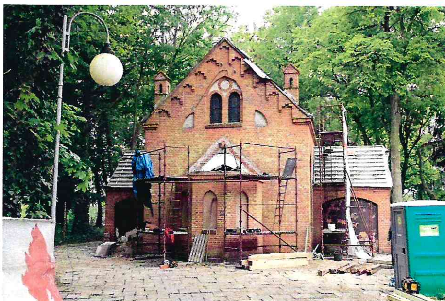
Zdjęcie kaplicy podczas remontu zewnętrznego

Z dniem 04.05.2020 r. zgłoszono zamiar rozpoczęcia robót budowlanych w Powiatowym Inspektoracie Nadzoru Budowlanego dot. remontu zewnętrznego kaplicy cmentarnej. Wykonano roboty budowlane zewnętrzne, w ramach którego zostały zrealizowane m.in. następujące prace: roboty pomiarowe, wymiana dachu, wymiana bram i drzwi zewnętrznych, odnowienie stolarki okiennej, roboty malarskie i towarzyszące, wykonanie opaski wokół budynku. 10 lipca 2020 r. dokonano końcowego odbioru robót.