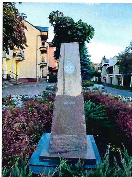
Zdjęcia obelisku upamiętniającego jubileusz 650 - lecia miasta Złotowa, jubileusz 30 – lecia polskiej samorządności oraz jubileusz 75 – lecia istnienia Cechu Rzemiosł Różnych w Złotowie