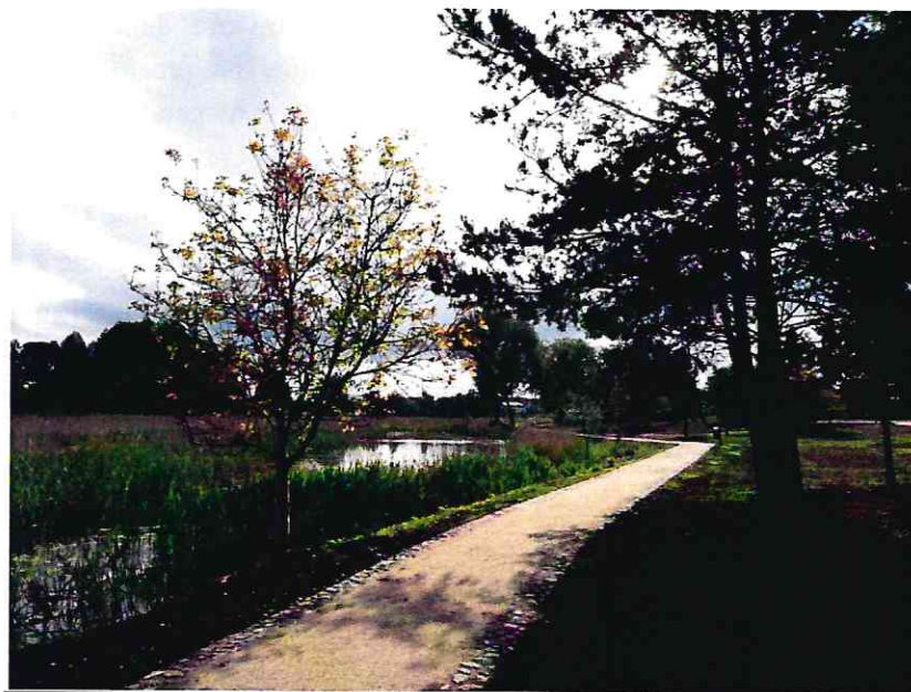
Zdjęcie części terenu przy ul. Mokrej po realizacji inwestycji

Inwestycja była współfinansowana ze środków Funduszu Spójności, w ramach Programu Operacyjnego Infrastruktura i Środowisko 2014-2020, działanie 2.5.