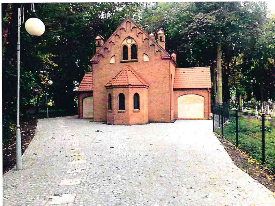
Zdjęcie kaplicy i terenu wokół kaplicy po realizacji utwardzenia terenu

Inwestycja była współfinansowana ze środków Funduszu Spójności, w ramach Programu Operacyjnego Infrastruktura i Środowisko 2014-2020, działanie 2.5.